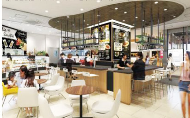
紀ノ国屋 渋谷スクランブルスクエア店 (2019年11月OPEN)